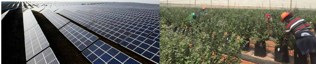
Solcelleanlægget i Ukraine og blåbærproduktionen i Sydafrika

Danish SDG Investment Fund bidrager til at realisere FN's 17 verdensmål gennem bæredygtige investeringer. Fonden har netop foretaget sine første to investeringer med DIP som medinvestor.