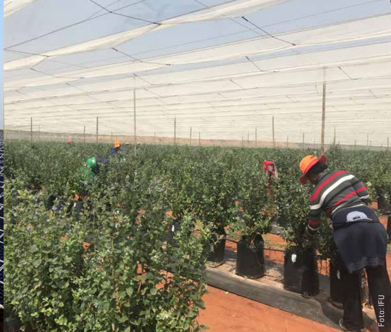
Solcelleanlægget i Ukraine og blåbærproduktionen i Sydafrika